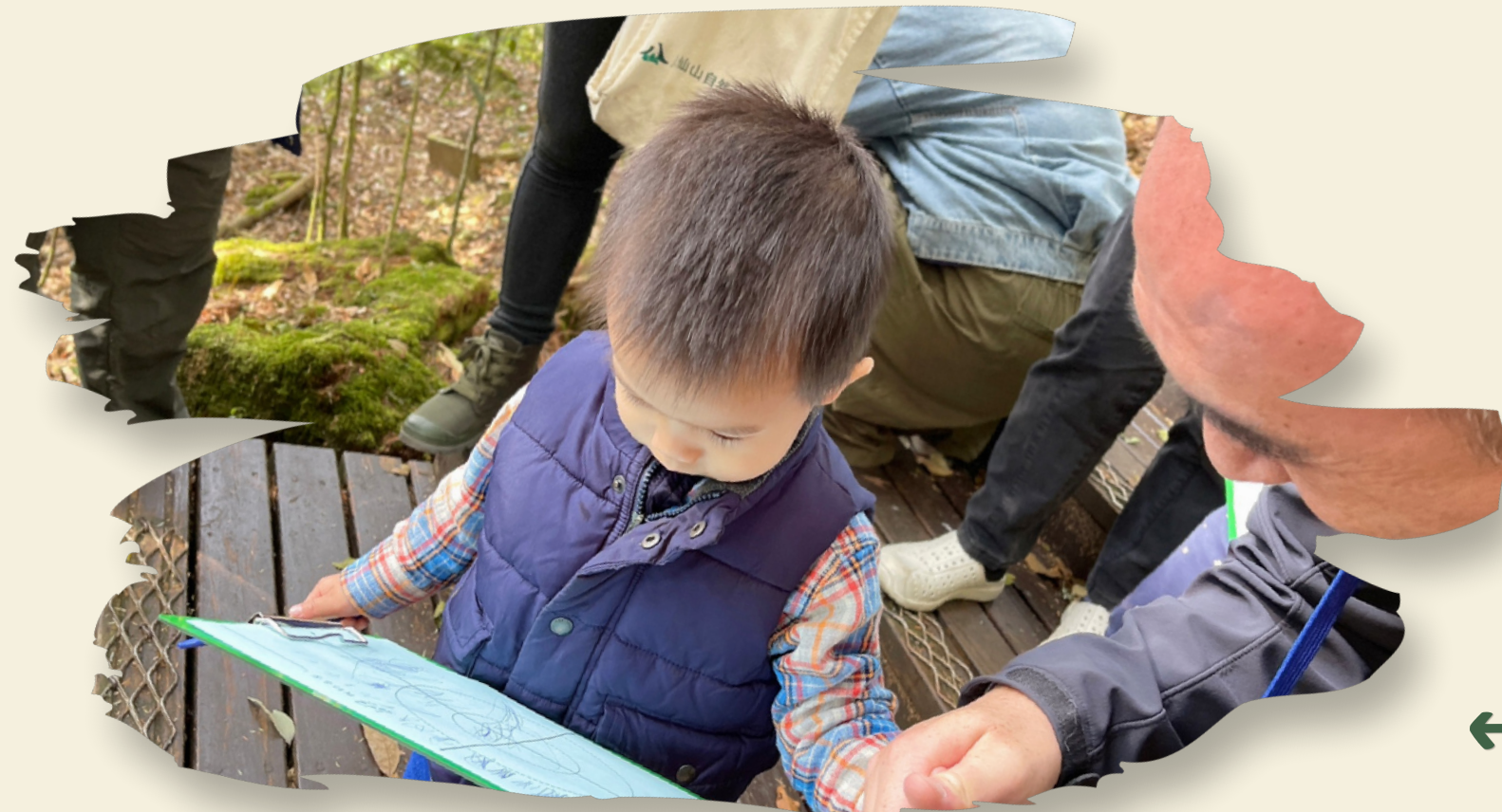
← 聽聽看，鳥兒在哪個方位？並紀錄下來！