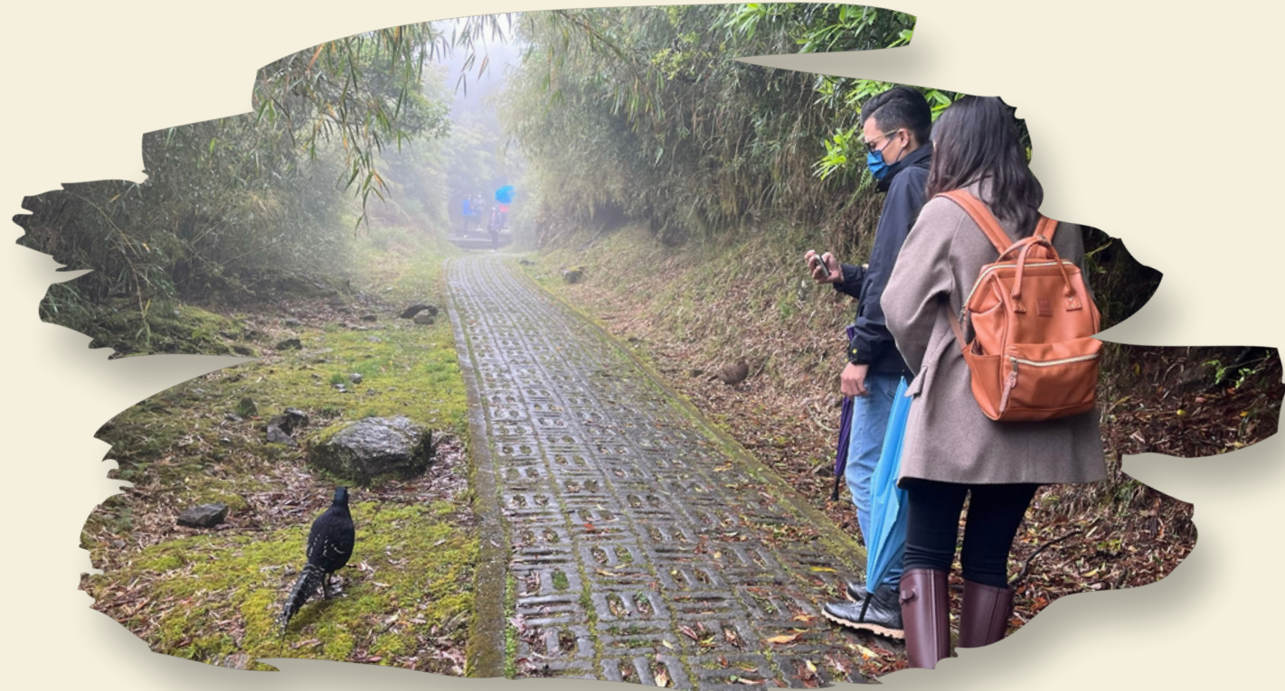
↑ 賞鳥時，跟帝雉來個不期而遇！？