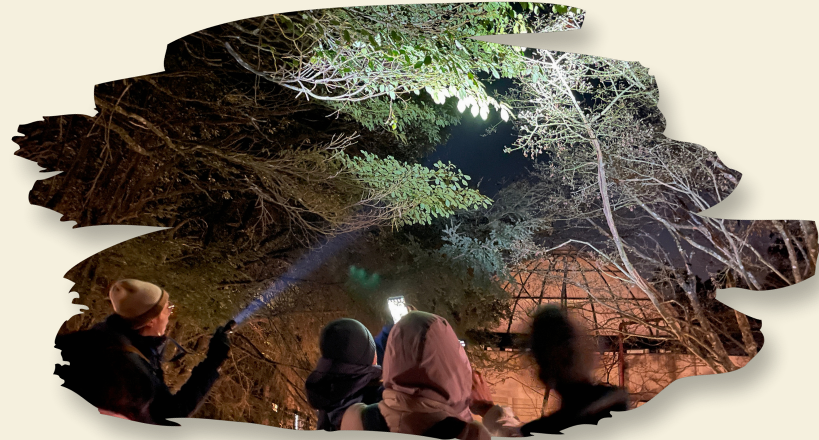
↑ 有沒有機會遇到夜間出現的飛鼠呢？